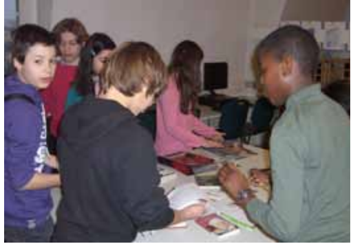
Les élèves au CDI