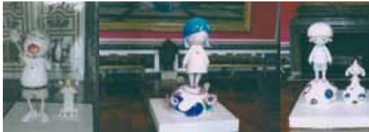
Autoportrait de l'artiste avec sa chienne Pou, Kaikai et Kiki (gardiens spirituels)