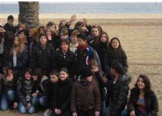
Les 4 e 4 et les 4 e 5 sur la plage